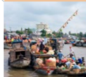
3 Vinh Long