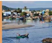
6 Phu Quoc