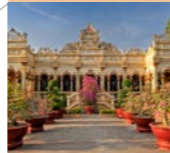
1 My Tho