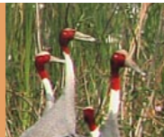
5 Tam Nong Vogelreservat