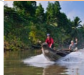
2 Ben Tre