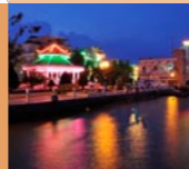
4 Can Tho